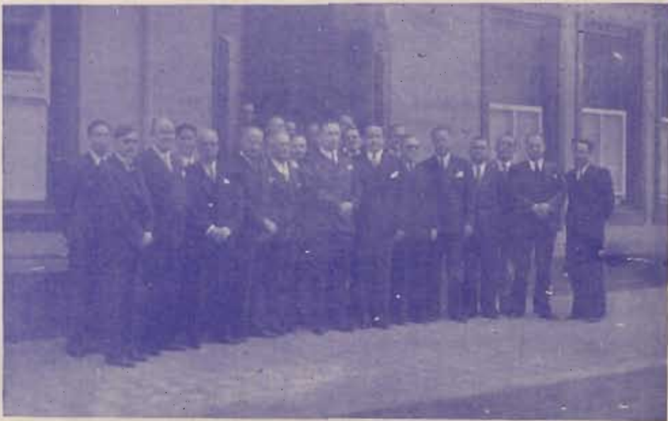
El Señor Presidente de la República con los Rectores y Delegados de las Universidades de América asistieron a la inauguración

"Cumple hoy el Gobierno de la República una de las promesas que consignó en su Mensaje inaugural el Sr. Presidente Calderón Guardia, al ofrecer a los maestros aspirantes y de certificado elemental, con el estableci-